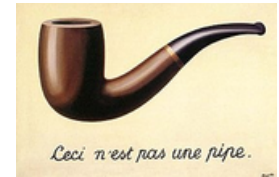
ijp p ijp pijp een pijp