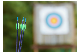
en p en pen een pen