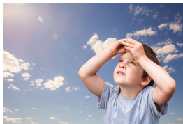
ijk k ijk kijk ik kijk