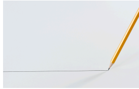
ijn l ijn lijn een lijn