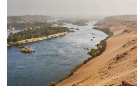
ijl n ijl nijl