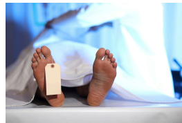
ijk l ijk lijk een lijk