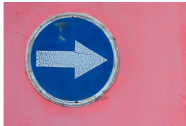
ijl p ijl pijl een pijl