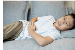
ijn p ijn pijn ik en pijn.