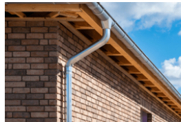
ijp p ijp pijp een pijp